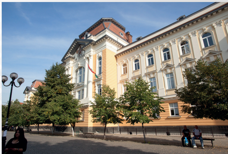
Закарпатський угорський інститут імені Ференца Ракоці II