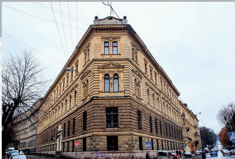
Львівський державний університет фізичної культури імені Івана Боберського